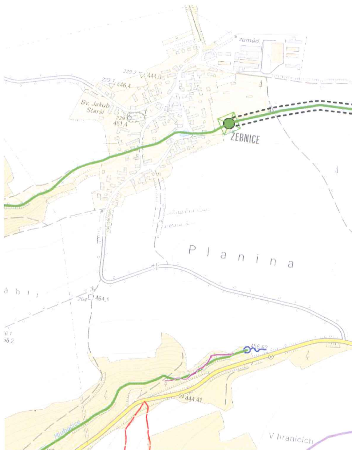
p.p.č. 1572/3 v k.ú. Žebnice